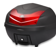
39l horní box City