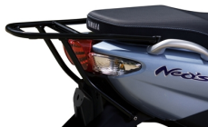
Nosič horních boxů Vysoký štít pro model Neo's