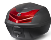
30l horní box City

For all Neo's 4 accessories go to the website, or check your local dealer